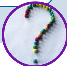
EN 1 MIN.