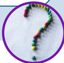
EN 1 MIN.