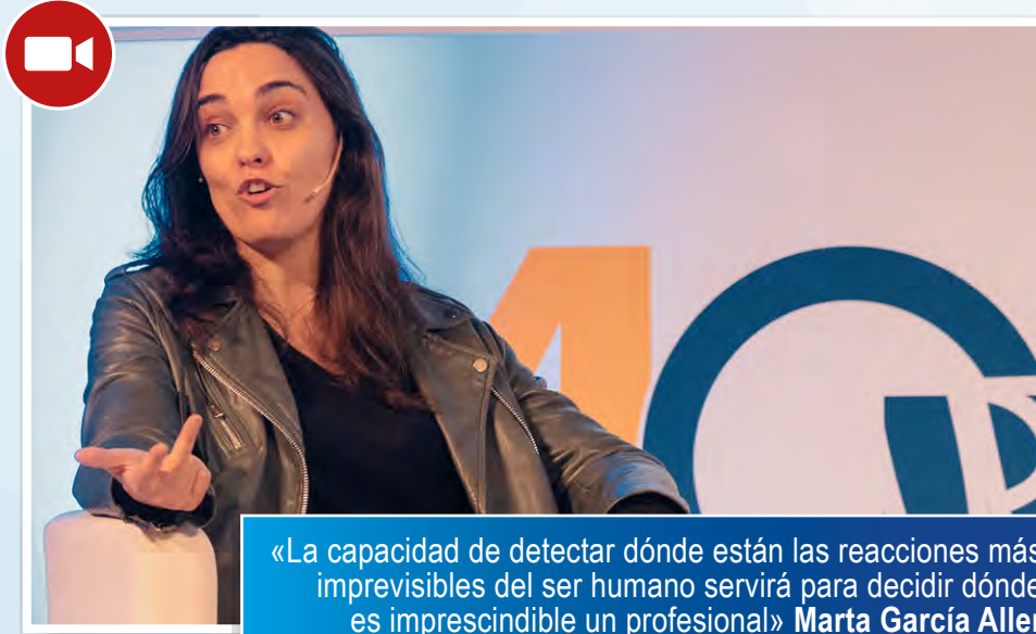
«La capacidad de detectar dónde están las reacciones más imprevisibles del ser humano servirá para decidir dónde es imprescindible un profesional» Marta García Aller