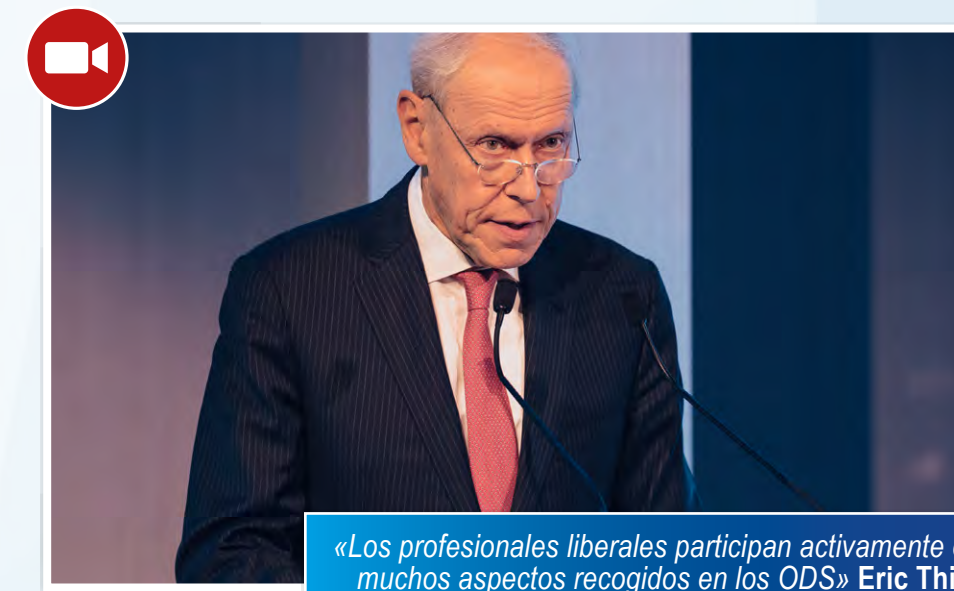
«Los profesionales liberales participan activamente en muchos aspectos recogidos en los ODS» Eric Thiry