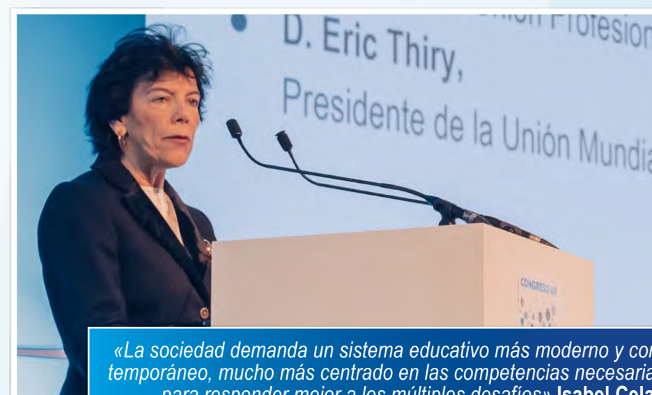
«La sociedad demanda un sistema educativo más moderno y contemporáneo, mucho más centrado en las competencias necesarias para responder mejor a los múltiples desafíos» Isabel Celaá