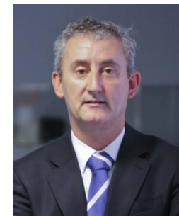
Consejo General de Colegios Oficiales de Médicos (CGCOM)