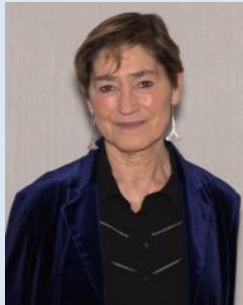
Consejo General de la Abogacía Española (CGAE)