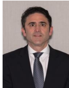
Consejo General de la Ingeniería Téc. Industrial (COGITI)