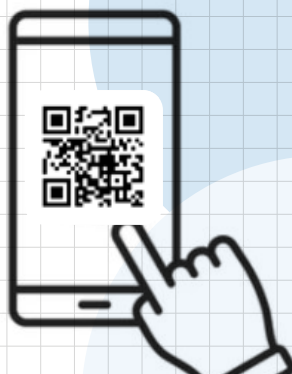
Oficina de Publicaciones de la Unión Europea