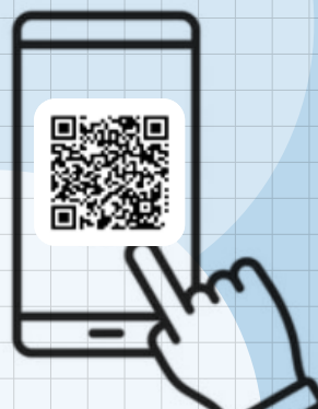
Cuadernillo Didáctica Europea