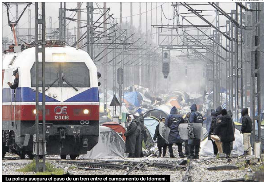
La policía asegura el paso de un tren entre el campamento de Idomeni.