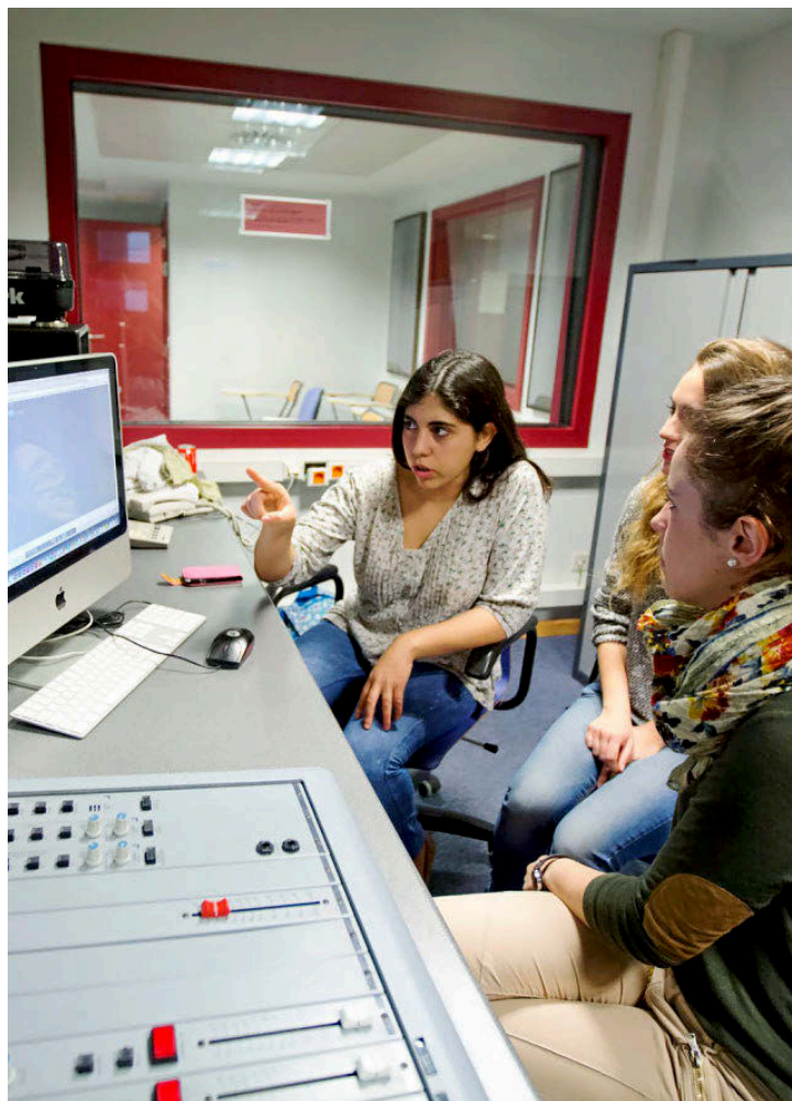
UNIVERSIDAD JAUME I