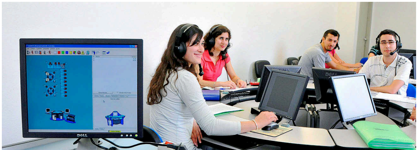
UNIVERSIDAD DE SANTIAGO DE COMPOSTELA

CONTACTO: Avda. Cervantes, 2. Málaga / 952 131 000 / www.uma.es / FUNDACIÓN: 1972 / TITULACIONES: 63 / PROFESORES: 2.445 / ALUMNOS: 37.100 / CAMPUS: Teatinos y El Ejido. Según la fundación Compromiso y Transparencia, la UMA obtiene el calificativo de Universidad Transparente. Además, es el primer centro en cantidad de alumnos implicados en proyectos de voluntariado y el tercero en solidaridad, por las 85 acciones altruistas que desarrollan los 2.819 estudiantes comprometidos. PUESTO EN EL RÁNKING GENERAL: 33º