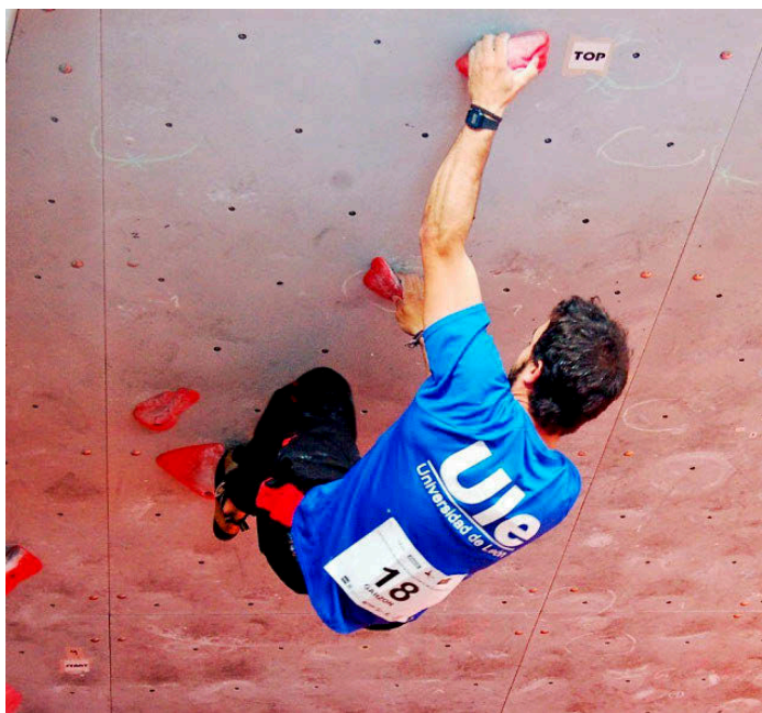
UNIVERSIDAD DE LEÓN

De consolidada vocación investigadora, ha sido reconocida con la distinción de Campus de Excelencia Internacional. Se trata de una universidad moderna, dinámica e innovadora con una amplia proyección internacional con el objetivo de ser el motor científico y contribuir al desarrollo social, económico y cultural de la sociedad burgalesa y española.