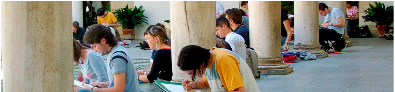
UNIVERSIDAD DE GRANADA

A la hora de elegir institución pública el catálogo es amplio: en España existen 26,47 universidades por cada millón de habitantes de entre 18 y 24 años. Entre todas imparten 2.028 títulos (frente a los 610 de la privada). Un curso más, Madrid es la comunidad autónoma con más oferta. Cuenta con 15 universidades. Le sigue Cataluña con 12 universidades presenciales y Andalucía, con 11. Por ramas, la preferida un año más son las Ciencias Sociales y Jurídicas con más de medio millón de estudiantes (el 45% del total), un 20,5% se decanta por Ingeniería o Arquitectura, el 17% elige Ciencias de la Salud, el 10,8 opta por Artes y Humanidades y el 6,7% por un título de Ciencias. A continuación, se detallan las universidades públicas españolas clasificadas según la posición obtenida en este ránking. El resto de universidades se presentan después por orden alfabético.