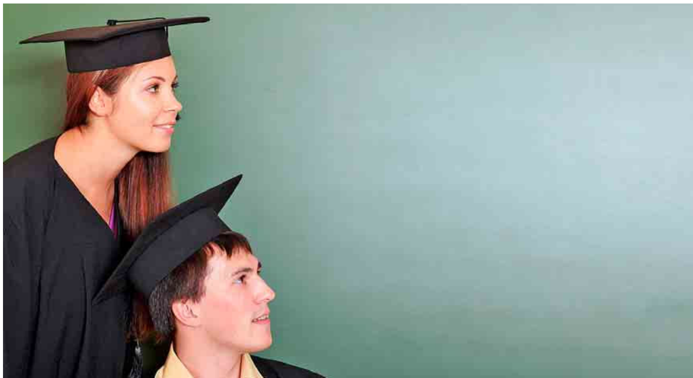
Dos jóvenes con la vestimenta tradicional de las ceremonias de graduación en los programas de educación superior.